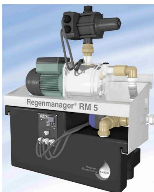
RM5 Plus Innenansicht