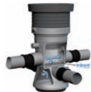
Beispiel: Trident 325 mit Revisionsrohr